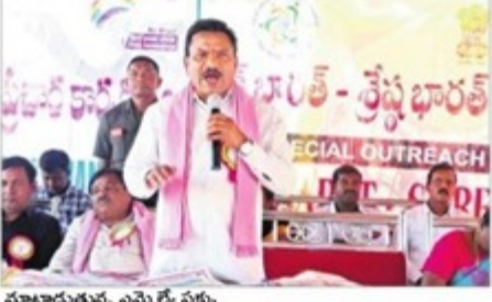
మాట్లాడుతున్న ఎమ్మెల్వే సక్కు

ధనుష్ 2.0'కార్యక్రమాన్ని డ్రవేశ'పెట్టిందని, ప్రతిఒక్కరికీ టీకాలు వేయించాలన్నారు. రాష్ట్ర ప్రభుత్వం పల్లె ప్రగతి పేరుతో ఎన్నో సంక్షేమ కార్యభమాలను విజయవంతం చేస్తున్నట్లు ఇదేశ్లలోపు చిన్నారులకు తప్పనిసరిగా టీకాలు ద్రధనుష్ 2.0 కార్యత్రమంపై జిల్లా వ్యాప్తంగా