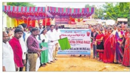
జీర్మూర్లో ర్యాలీ నిర్వహిస్తున్న ప్రజాప్రతినిధులు, విద్యార్శలు

విద్యార్థుల ర్యాలీ జాతీయ సమైక్యతా దినోత్సవం సందర్భంగా మండల కేంద్రంలో విద్యార్థులతో కలసీ